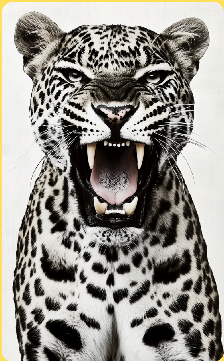
Studio photography, front view. a roaring leopard. white plain background --chaos 5 --ar 9:16 --style raw --sref 1532025248 - -sw 50 --v 6.1