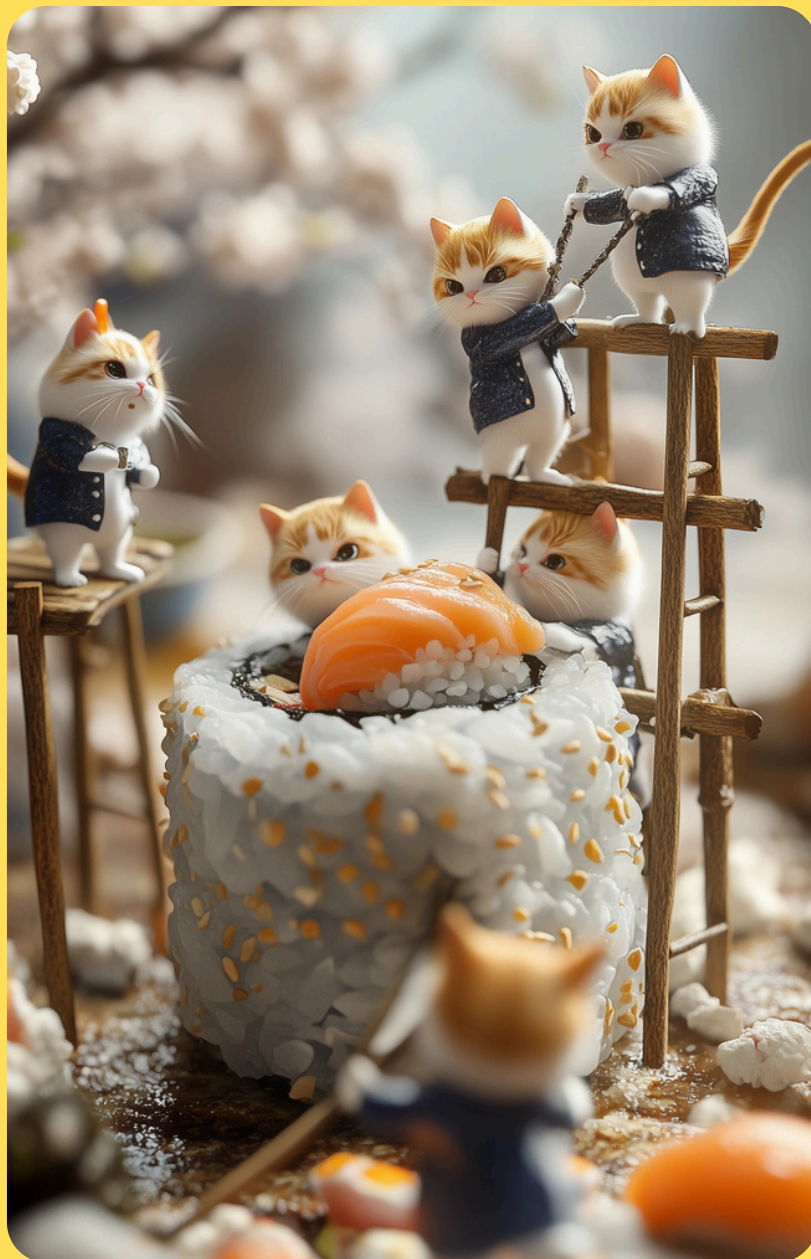
Ultra-realistic macro shot of a giant, freshly made sushi roll being worked on by tiny cats dressed in professional kitchen uniforms. Some cats are standing on scaffolding. Scene highly detailed and photorealistic. --ar 9:16 --style raw --stylize 150 --v 6.1